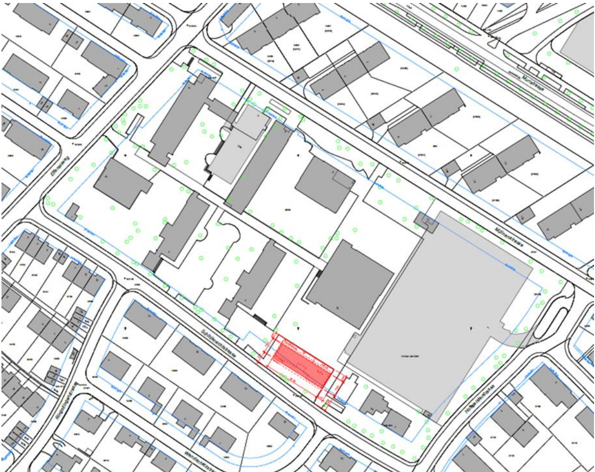
Geplanter Standort des Provisoriums im VS Manuel

Für das Projekt wurden folgende Ziele definiert: