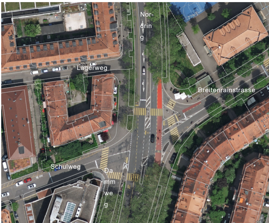
Abbildung 1: Übersicht Knoten Nordring/Breitenrainstrasse/Schulweg

Es wurden folgende Alternativen zur Erneuerung der Lichtsignalanlage geprüft: