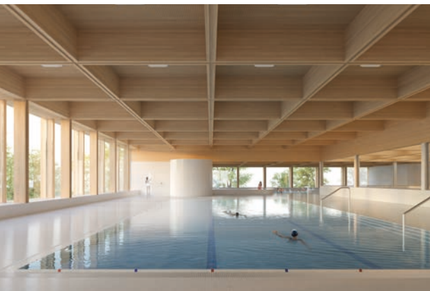
Die Visualisierung zeigt das Lehrschwimmbekken des neuen Hallenbads. Im Hintergrund ist der Planschbereich zu sehen. Die Fenster zeigen auf das Freibad Weyermannshaus hinaus.