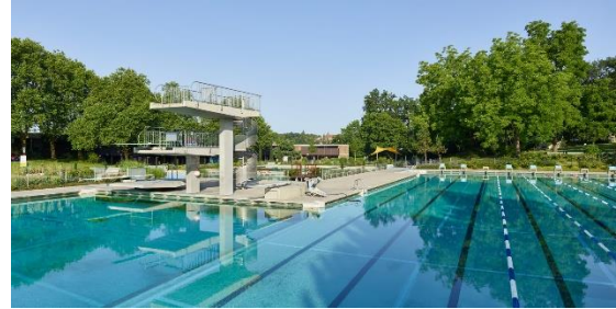
Abb. 3: 50-Meter-Becken mit Sprungturbereich