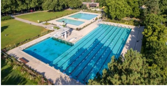
Abb. 2: Vogelperspektive Aussenbeckenanlage

Die gesamte Anlage weist nach fast fünfzig Betriebsjahren ohne umfassende Sanierung wachsende Schäden auf. Die Becken sind undicht und müssen in regelmässigen Intervallen stellenweise behelfsmässig nachgedichtet werden. Die Bausubstanz ist aufgrund der Feuchte teilweise angegriffen und muss saniert werden. Die Badewassertechnik ist veraltet und muss ersetzt werden. Das Kinderplanschbecken entspricht nicht mehr den heutigen Anforderungen und Vorschriften. Auch fehlende Spielmöglichkeiten und veränderte Bedürfnisse von Kindern rechtfertigen eine Sanierung oder Neugestaltung des Kinderbeckens. Die Spielgeräte und der Fallschutz des bestehenden Kinderspielbereichs sind teilweise in einem schlechten Zustand und müssen ersetzt werden. Das kleine Gardero- ben- und Dienstgebäude im Bereich des ehemaligen Lehrschwimmbeckens weist veraltete haus- technische Installationen sowie eine sanierungsbedürftige Gebäudehülle auf.