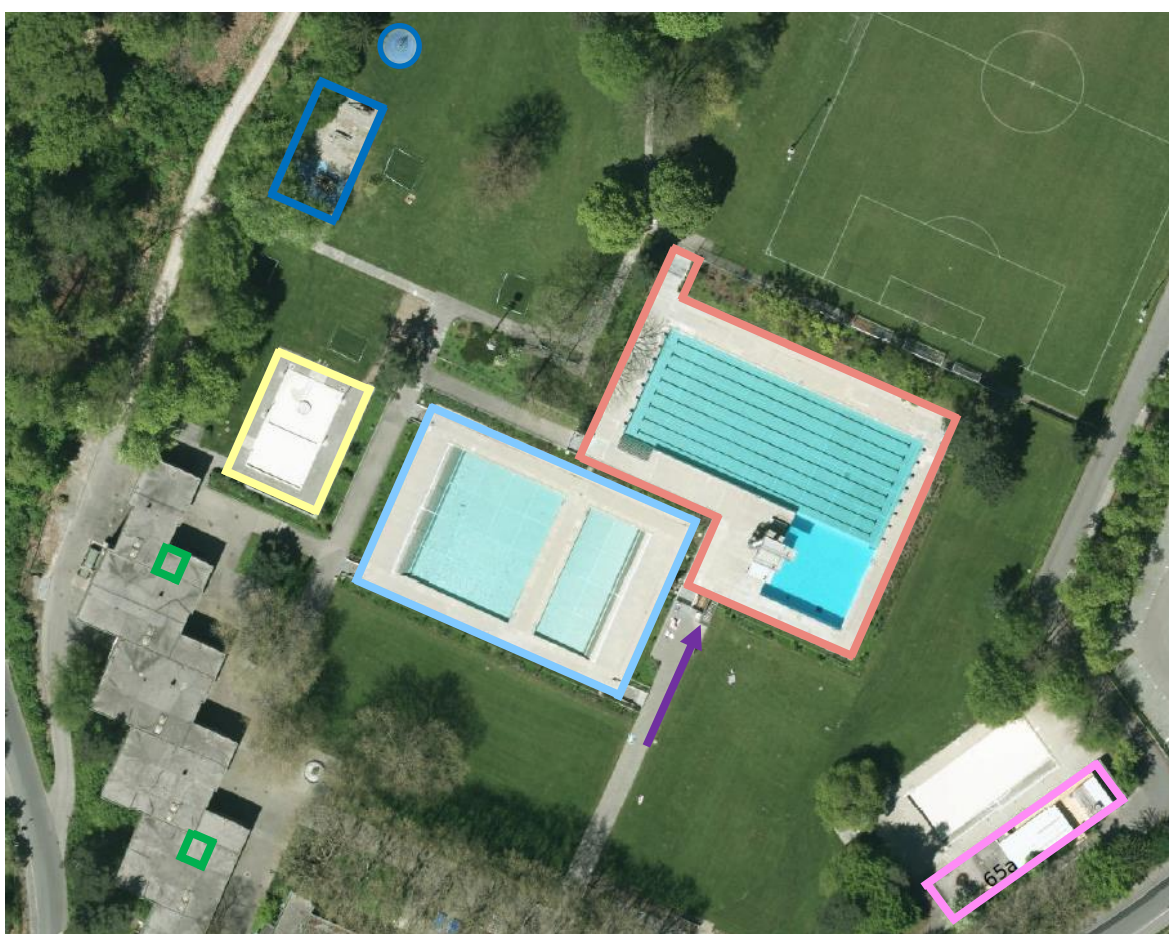
Abb. 10: Lageplan: Kinderplanschbecken (Gelb); Nichtschwimmbecken (Hellblau); Schwimmbecken und Sprungbereich (Rot); Abgang Technik (Pfeil Violett); kleines Garderoben- und Dienstgebäude (Pink); Spielbereich Kinder (Dunkelbau), IV-WC Kabinen (Grün)