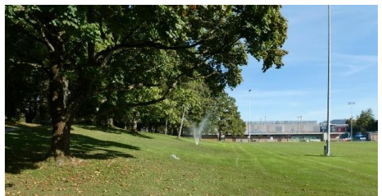
Abb. 9: Fussballfeld & Garderobengebäude Sportplatz