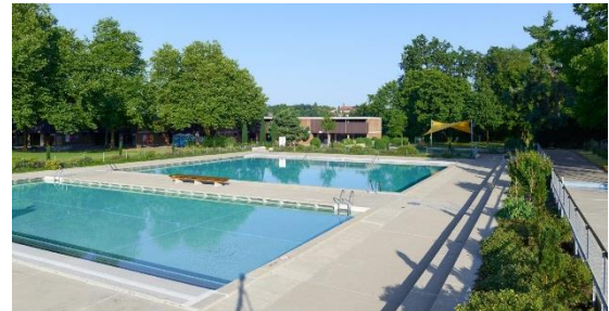
Abb. 5: Nichtschwimmbecken