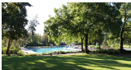
Abb. 7: Liegewiese mit Baumbestand