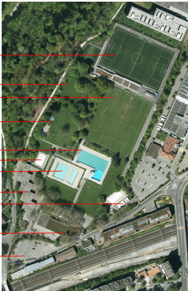
Abb. 1: Wylerbad (Orthofoto 2016)