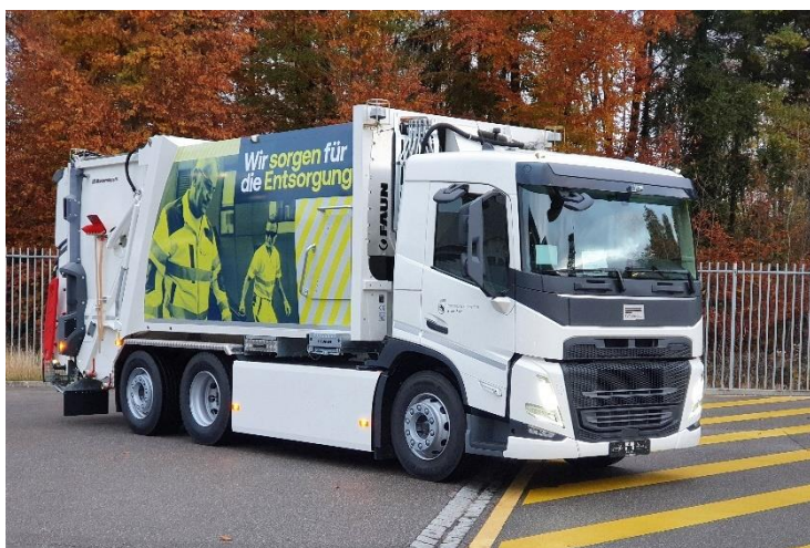
Abbildung 1: Vollelektro-Kehrriechwagen mit konventionellem Aufbau.