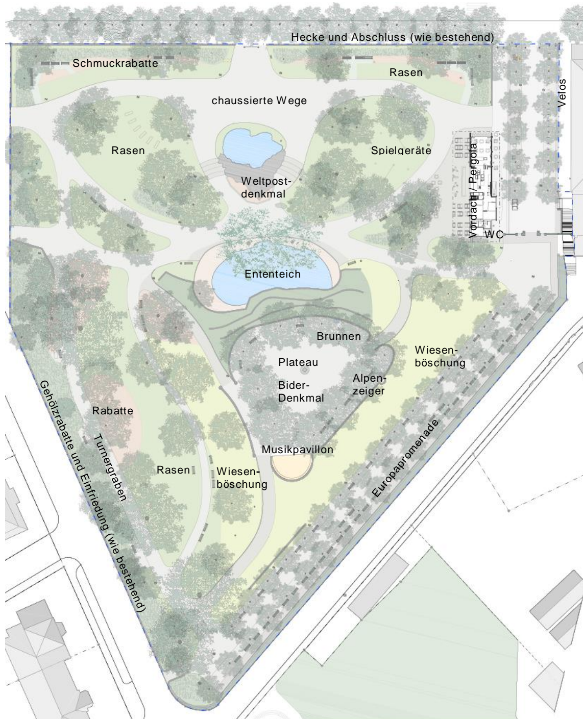
Schauplan zum Bauprojekt, ohne Massstab

Das Sanierungsprojekt des Fonds sieht vor, dass sich der Gastraum des Park-Cafés im Norden künftig in beide Richtungen, also Richtung Park sowie neu auch Richtung Christoffelgasse hin öffnet und so ein rundum attraktiver Eingangsbereich entsteht. Christoffelgasse und Park werden so gestalterisch und funktional miteinander verwoben. Die Konzeption des Raums zwischen Park-Café und Bernerhof als Allee, welche zum historischen, repräsentativen Tor zur Europapromenade führt,