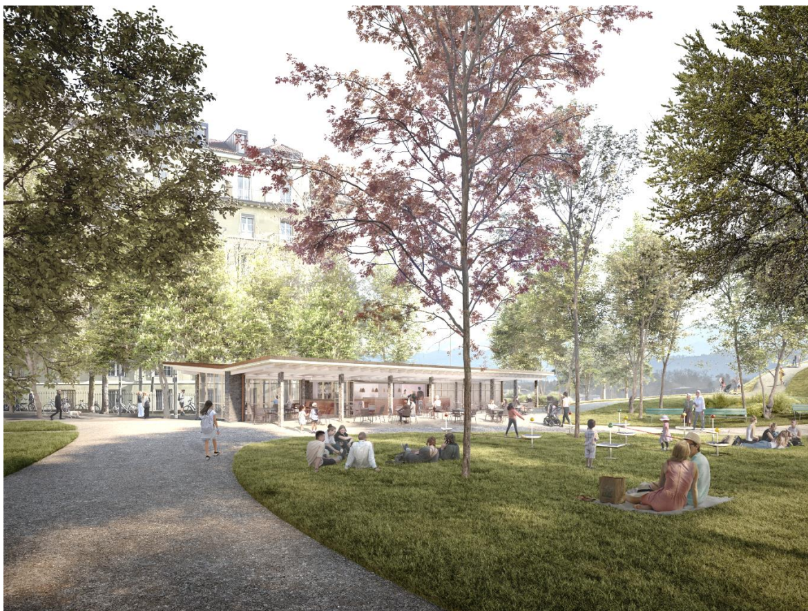
Visualisierung; Blick Richtung Bernerhof