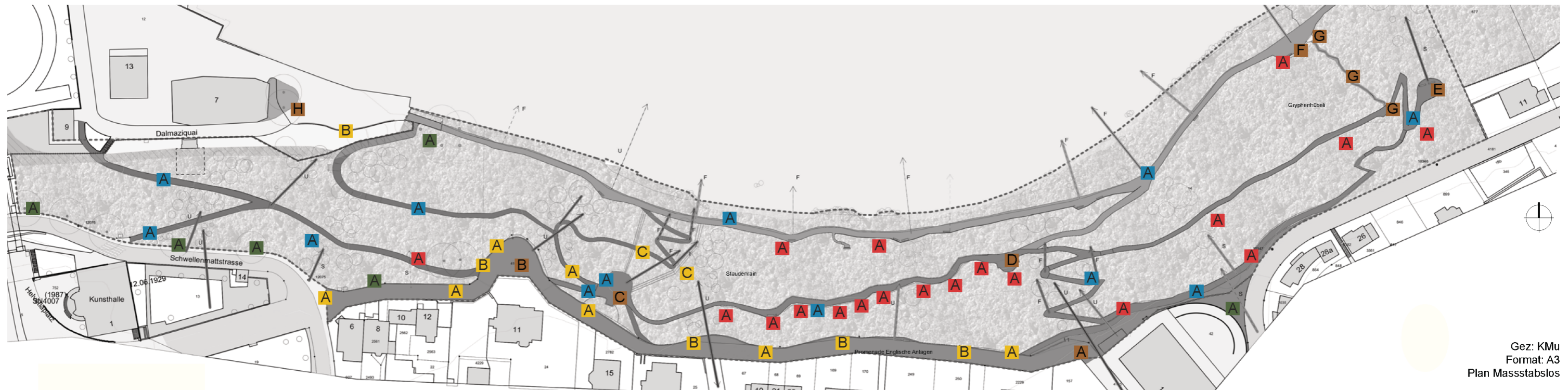
Gez: KMu Format: A3 Plan Massstabslos