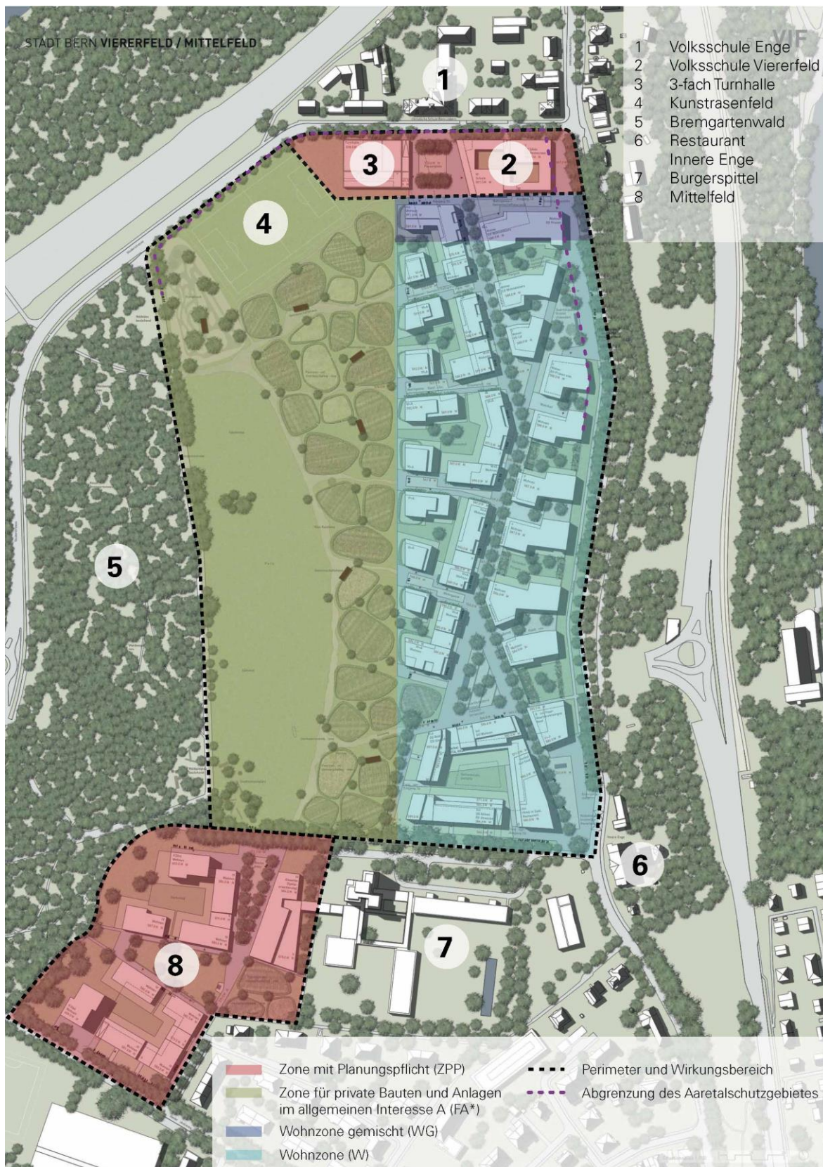
Situationsplan Siegerprojekt «VIF!» (Ammann Albers Stadtwerke / raderschallpartner Landschaftsarchitekten / huggenbergerfries Architekten / Basler & Hofmann / zeugin.gölker.immobilienstrategien)