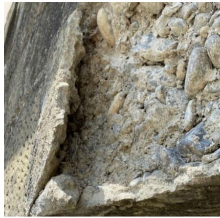
Schadhafte und lose Betonschale im Sturzbereich