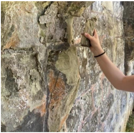
Durch Verwitterung loses Mauerwerk am Kamin