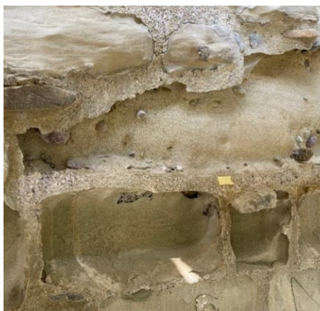
Starke Verwitterung des Sandsteins, die harten Betonfugen bleiben stehen.

Die Bauarbeiten waren in zwei Etappen geplant: Sanierung Hauptburg (Bauetappe 1) im Jahr 2022, Sanierung Vorburg (Bauetappe 2) im Jahr 2023. Im April 2022 begannen die Arbeiten mit dem Einrücken der Hauptburg sowie der Aufnahme des Ist-Zustands und der Analyse der vorhandenen Schäden an der Hauptburg durch die beauftragte Firma Wirz Restauratoren. Diese Analyse war notwendig, um die richtigen Sanierungsmassnahmen zu definieren und ein Unterhaltskonzept für die Zeit nach der Sanierung zu entwickeln. Die Mauern der Hauptburg wurden von der beauftragten Firma von April bis Juni 2022 in digitalen Schadenskartierungen dokumentiert. Im Zuge der Zustandsaufnahme und Schadensanalyse stellten die Fachleute fest, dass der Schadensumfang und die Schadenstiefe am Mauerwerk ein deutlich grösseres Ausmass aufwiesen als in der Planungsphase 2018 erkennbar und abschätzbar. Erst vom Gerüst aus und mit dem Blick von oben auf das Mauerwerk waren die Schäden in ihrem wahren Ausmass erkennbar, wie zum Beispiel die Schalenbildung, bei der sich von oben her Hohlräume und senkrechte Platten an den Sandsteinsteinen ausbilden, die herunterfallen, wenn sie weit genug verwittert sind.