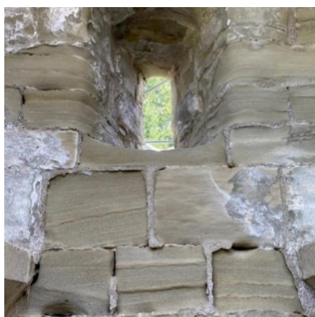
Starke Verwitterungsschäden bei den Fenster-nischen