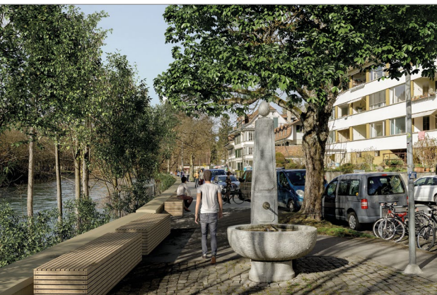
Visualisierung Uferweg im Altenbergquartier: Zum Schutz der Altenbergstrasse sind entlang des Uferwegs mehrere Schutzmauern vorgesehen.