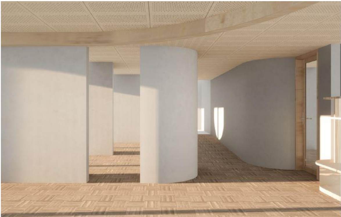
Visualisierung der Materialisierung vom Neubau mit Holzdecken und -böden, abgerundeten Ecken und dem Zugang (via Rampe) zum Pfarrhaus.