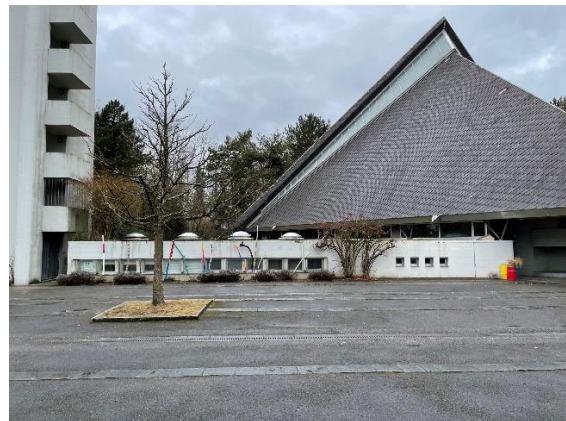
1. Ansicht von der Reichenbachstrasse (links: Kirchturm, dahinter die Kirche, rechts: Kirchgemeindehaus), 2. Das Pfarrhaus (Gartengeschoss), 3. Das Kirchgemeindehaus, 4. Links der Turm, mittig die Sakristei, rechts die Kirche.