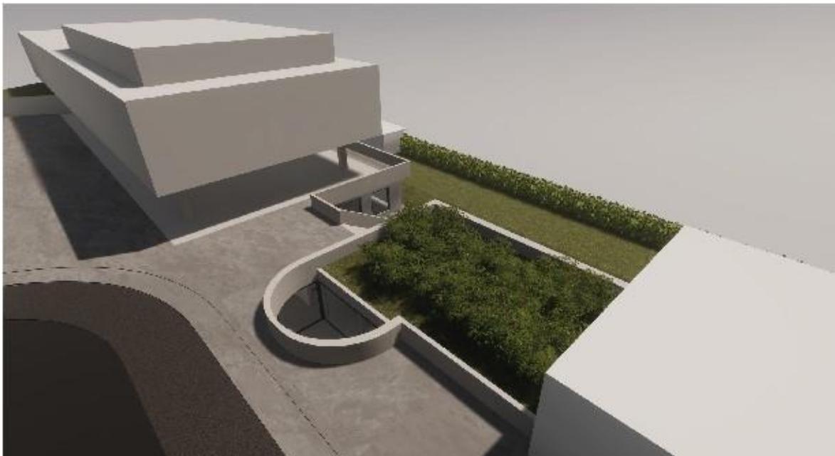
Schematische Darstellung der Baukörper. Oben: Kirchgemeindehaus, mittig der (bepflanzte) Zwischenbau mit Treppe zum UG und Lichthof, unten das bestehende Pfarrhaus.

Mit einem Neubau sollen die beiden Gebäude (Kirchgemeindehaus und Pfarrhaus) verbunden und erschlossen werden. Er orientiert sich mit seiner Sichtbetonbauweise am Bestand und fügt sich ins Ensemble ein. Im neuen Gebäudeteil soll zukünftig eine Gruppe der Kita untergebracht werden. Er enthält nebst einem Aufenthaltsraum auch Räume zum Essen (inkl. Teeküche), zum Ruhen, für Aktivitäten (Atelier und Bewegungsraum), Toiletten und ein Lager. Der Neubauteil befindet sich unterhalb der Hangkante und ist dreiseitig erd- resp. gebäudeberührt. Südöstlich erlaubt eine Fensterfront den Zugang zum Aussenraum und den Lichteinfall. Dieser wird im hinteren Gebäudeteil zusätzlich mit einem Lichthof unterstützt, welcher auch die natürliche Belüftung ermöglicht. Die Dachfläche soll intensiv begrünt werden.