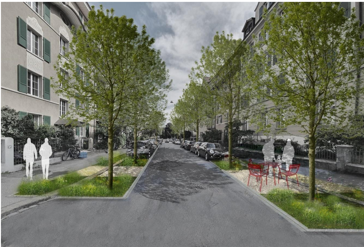
Abb. 7: Visualisierung Klimaanpassungsmassnahmen Optingenstrasse