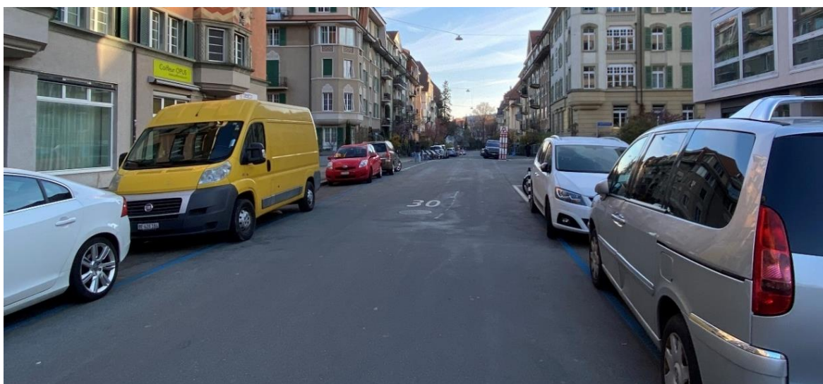
Abb. 3: Ist-Zustand Optingenstrasse (Fassade zu Fassade = 15m, Strassenbreite = 8m)

Die Optingenstrasse, eine Quartierstrasse im Breitenrain, ist in ihrer heutigen Ausgestaltung für Quartiernutzungen ungeeignet. Der Strassenraum beträgt von Fassade zu Fassade 15 m und von Trottoir zu Trottoir 8 m, die Oberfläche ist heute vollständig versiegelt und heizt sich in den Sommermonaten entsprechend stark auf. Mittelpunkt der Strasse sind heute die Parkplätze, eine Aneignung der Strasse durch Kinder und die Quartierbevölkerung, wie sie die Legislaturrichtlinien und die darauf aufbauende Strategie «Bern baut» vorsehen, ist nicht möglich.