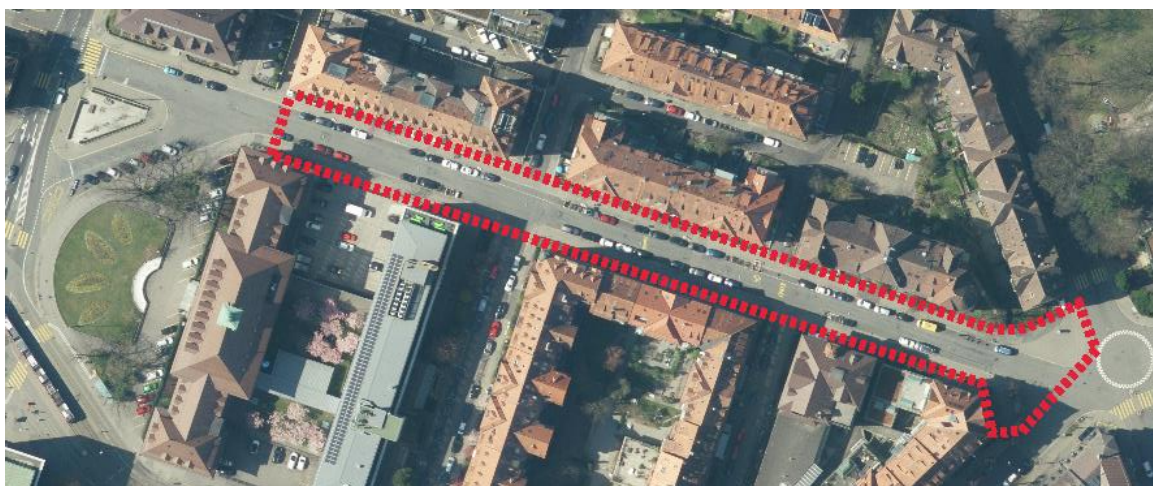
Abb. 3: Der Projektperimeter reicht von der Viktoriastrasse bis zum Kreisel an der Breitenrainstrasse (ca. 300m).