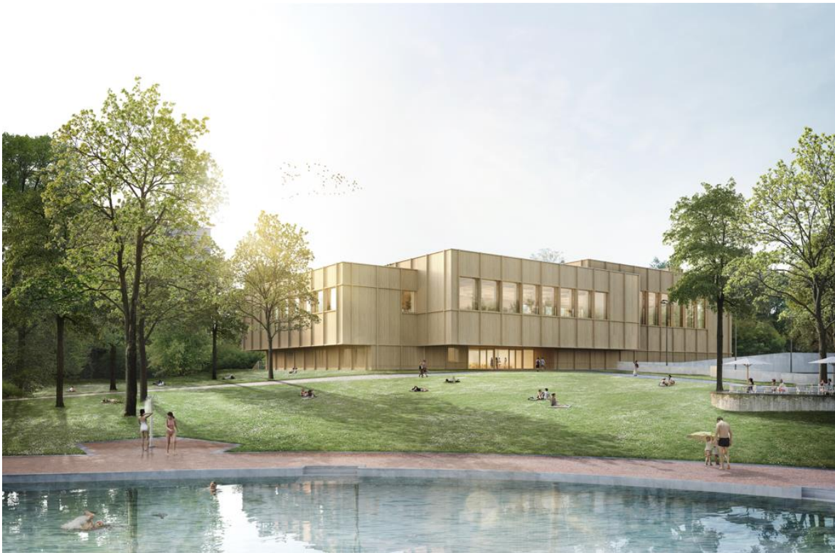
Abb. 9: Visualisierung des Neubaus (Bild: Maaars Architektur Visualisierungen)

Das Gebäude ist aus allen Richtungen zugänglich. Der überdeckte Haupteingang ist zum Parkinnern ausgerichtet und befindet sich zwischen dem Neubau und dem Ausseneisfeld. Auf der Westseite ist auf dem Niveau der Stöckackerstrasse ein Gebäudezugang für den Betrieb und die Vereinsmitglieder der Eishockeyvereine vorgesehen. Besucher*innen betreten das Gebäude über eine Empfangshalle mit einem verglasten Atrium und Blickbezug in die Eishalle. Seitlich an das Atrium angegliedert ist eine prägnante Treppe, darüber gelangen die Besucher*innen entweder in das Hallenbad im Obergeschoss oder in den Eisbereich im Untergeschoss.