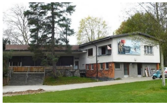
Abb. 8: Pavillongebäude