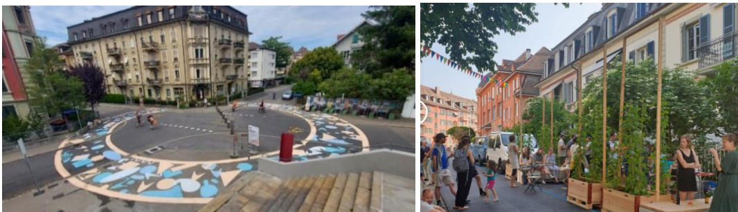
Abb. 1: Testmassnahme Muesmatt, Quartierbalkon Balmweg