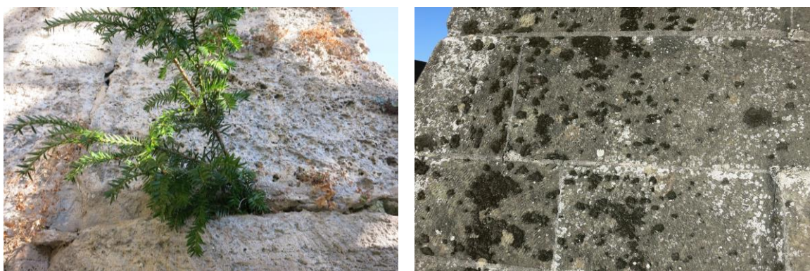
Bild 3 + 4: Pflanzenbewuchs