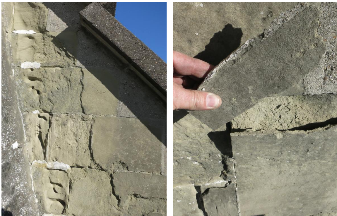
Bild 1 + 2: Ausgewaschene Quader, Schalenbildung und Abplatzungen

Um die Stützmauer in ihrem Bestand zu erhalten und die Gebrauchstauglichkeit sowie Sicherheit langfristig zu gewährleisten, sind nun umfassende Sanierungsmassnahmen notwendig.