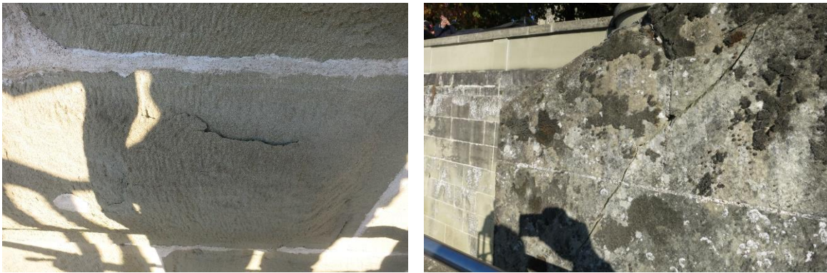
Bild 5 + 6: Schalen- und Rissbildung