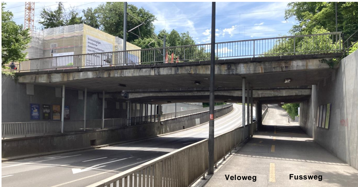
Abb. 1 (Blickrichtung Köniz): Ansicht der Brücke und der darunter liegenden Stützmauern entlang der Schwarzenburgstrasse; dahinter liegend die Eisenbahnbrücke (diese ist Eigentum der BLS und nicht Gegenstand des vorliegenden Antrags).

Die Stützmauern entlang der Schwarzenburgstrasse weisen lokale Schadstellen auf, zudem sind die dortigen Geländer nach aktuell gültigen Normen zu niedrig.