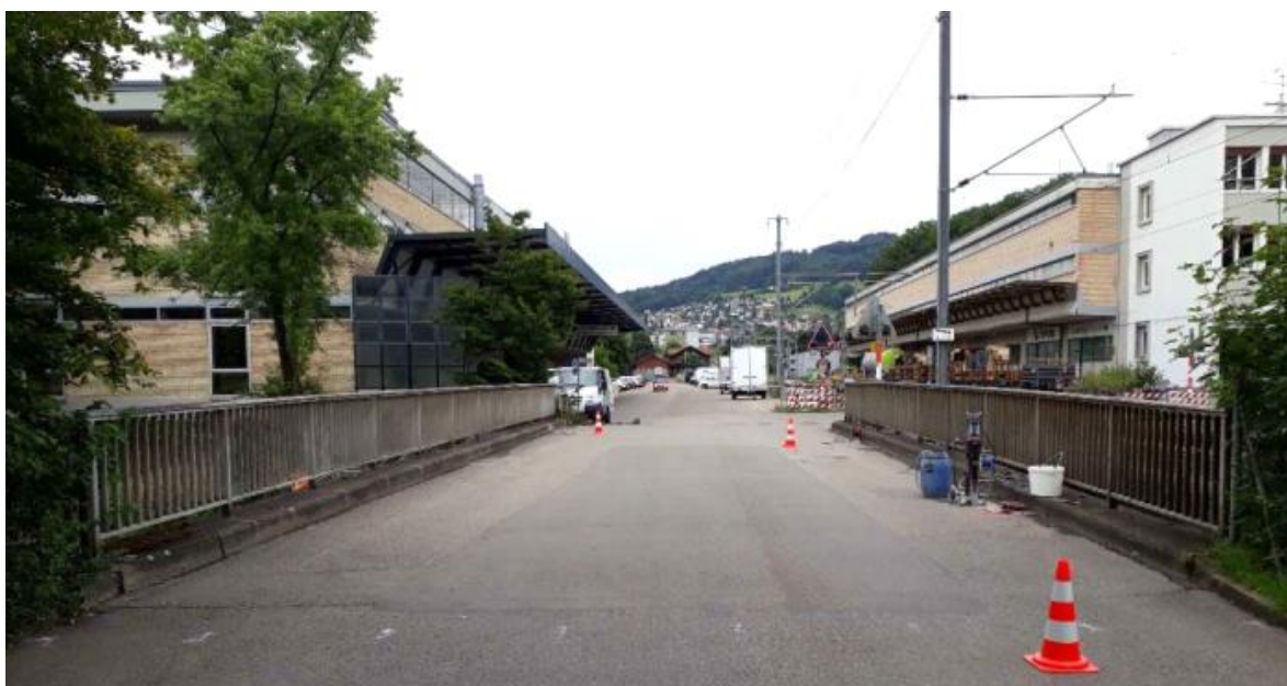
Abb. 2 (Blickrichtung Bahnhof Weissenbühl): Ansicht der Brückenoberfläche.