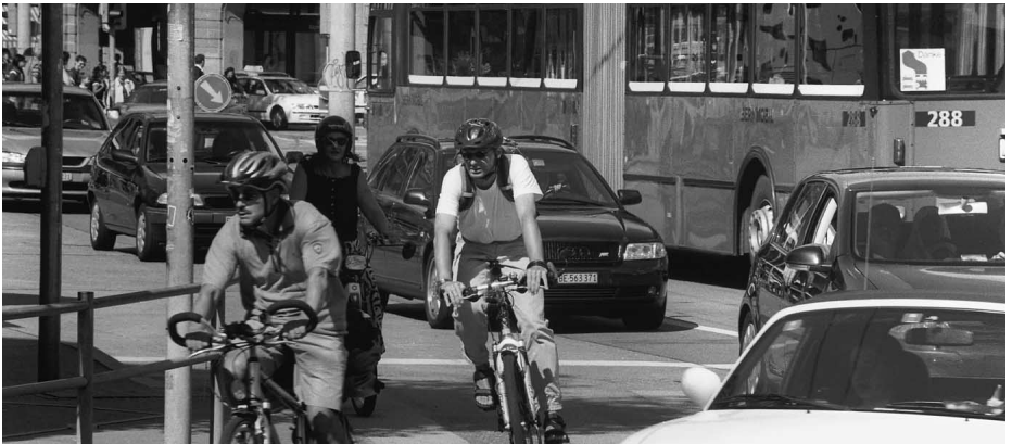
Bahnhofplatz: Verkehrsdrehscheibe mit beschränkten Platzverhältnissen.

Die Fahrbahnen verlaufen auf dem Bahnhofplatz parallel zum Aufnahmegebäude mit dem neuen Südportal und annähernd parallel zu den Fassaden des Burgerhospitals. Mit dieser gemässigt orthogonalen (d.h. rechtwinkligen) Fahrbahngeometrie