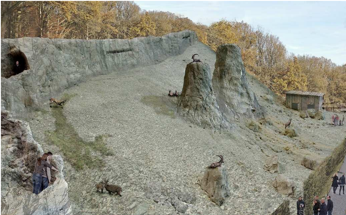
Visualisierung Steinwildgehege von der Voliere aus gesehen