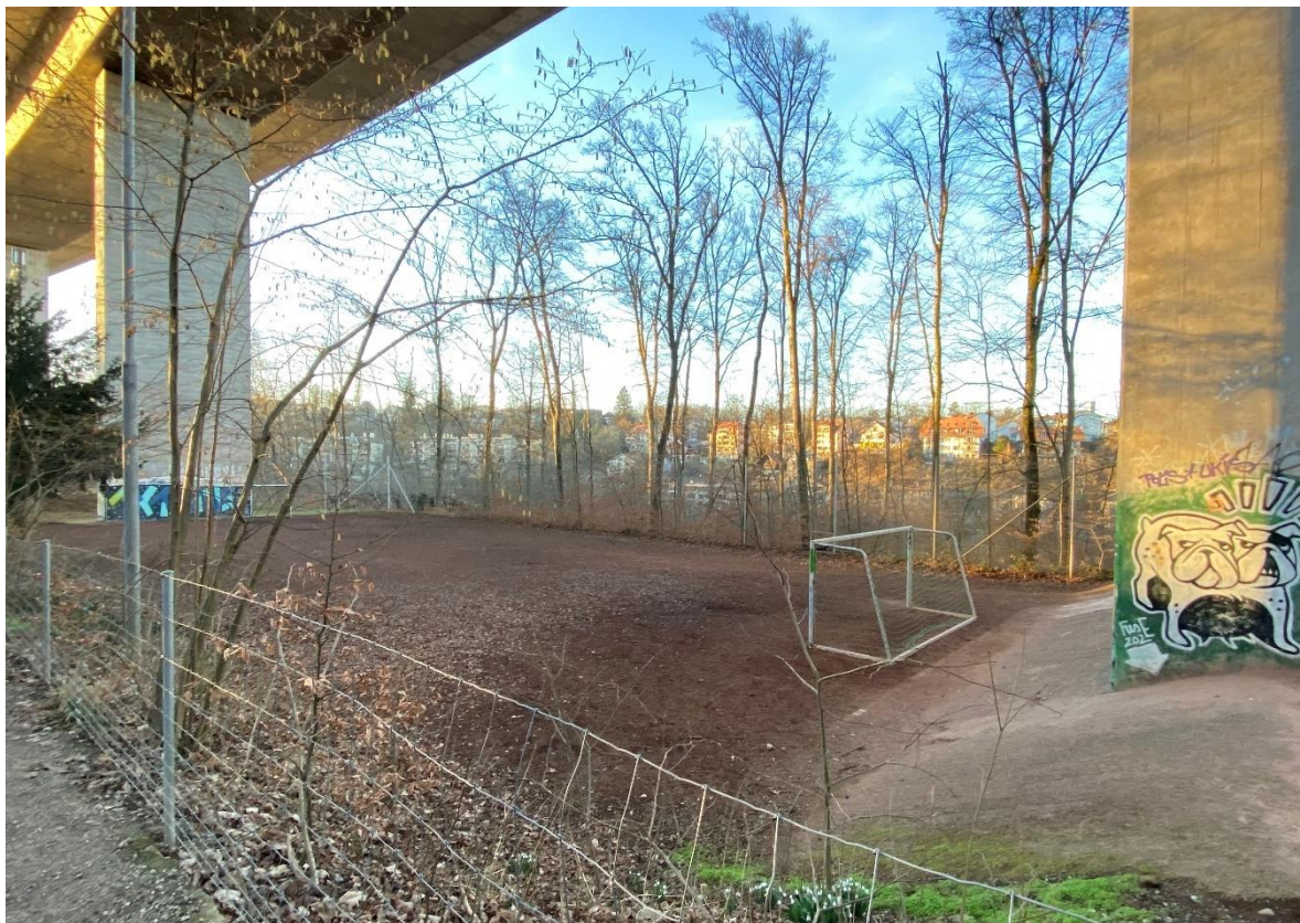
Heute bestehender Allwetter-Hartplatz unter dem Autobahnviadukt

Die heutige Spielfeldgrösse von ca. 43m x 21m wird beibehalten und maximal ausgenutzt. Das vorhandene Zugangstor und die Platzzufahrt sollen auf drei Meter verbreitert werden, um die Zufahrt der Maschine für die Pflege und weiterer Unterhaltsgeräte zu ermöglichen. Der bestehende Ballfangzaun wird instandgesetzt und nur wo notwendig erneuert. Die vorhandene Platzbeleuchtung wird ebenfalls instandgesetzt. Es ist zudem eine Umrüstung auf LED geplant. Die südliche Böschung des Platzes soll mit einheimischen Waldstauden bepflanzt werden, um den heute offenen Erdboden zu schliessen und somit die Böschung vor Erosion zu schützen, den Sandeintrag auf das Spielfeld zu minimieren und ungewünschten Bewuchs zu verhindern. Die Planung des neuen Platzes ist auf ein Minimum an Unterhaltsaufwand ausgelegt.