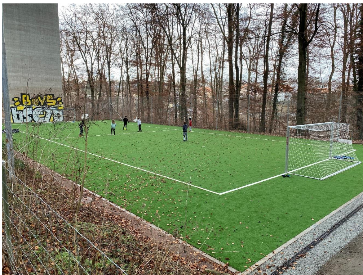
Foto des im Jahr 2021 umgewandelten 1. Kunstrasenspielfeld