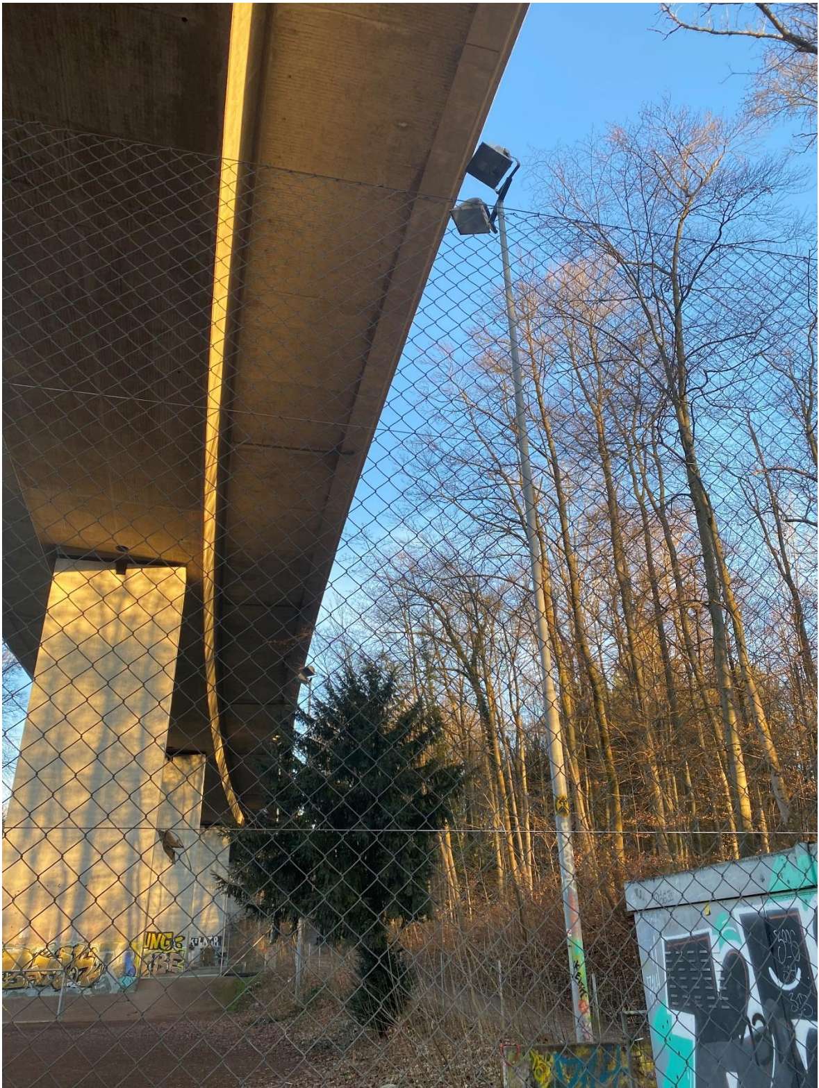
Bestandsplatzbeleuchtung und Situation Platz in Waldnähe, rechts unten das Bestands-WC

Aus ökologischen Gründen wurde wieder ein Kunstrasenspielfeld «Typ unverfüllt» geplant. Diese Wahl entspricht dem städtischen Konzept, wonach für neue Anlagen oder bei Ersatz von bestehenden Feldern möglichst ein unverfüllter Kunstrasen oder ein Kunstrasen mit einer ökologisch vertretbaren Verfüllung gewählt werden soll.