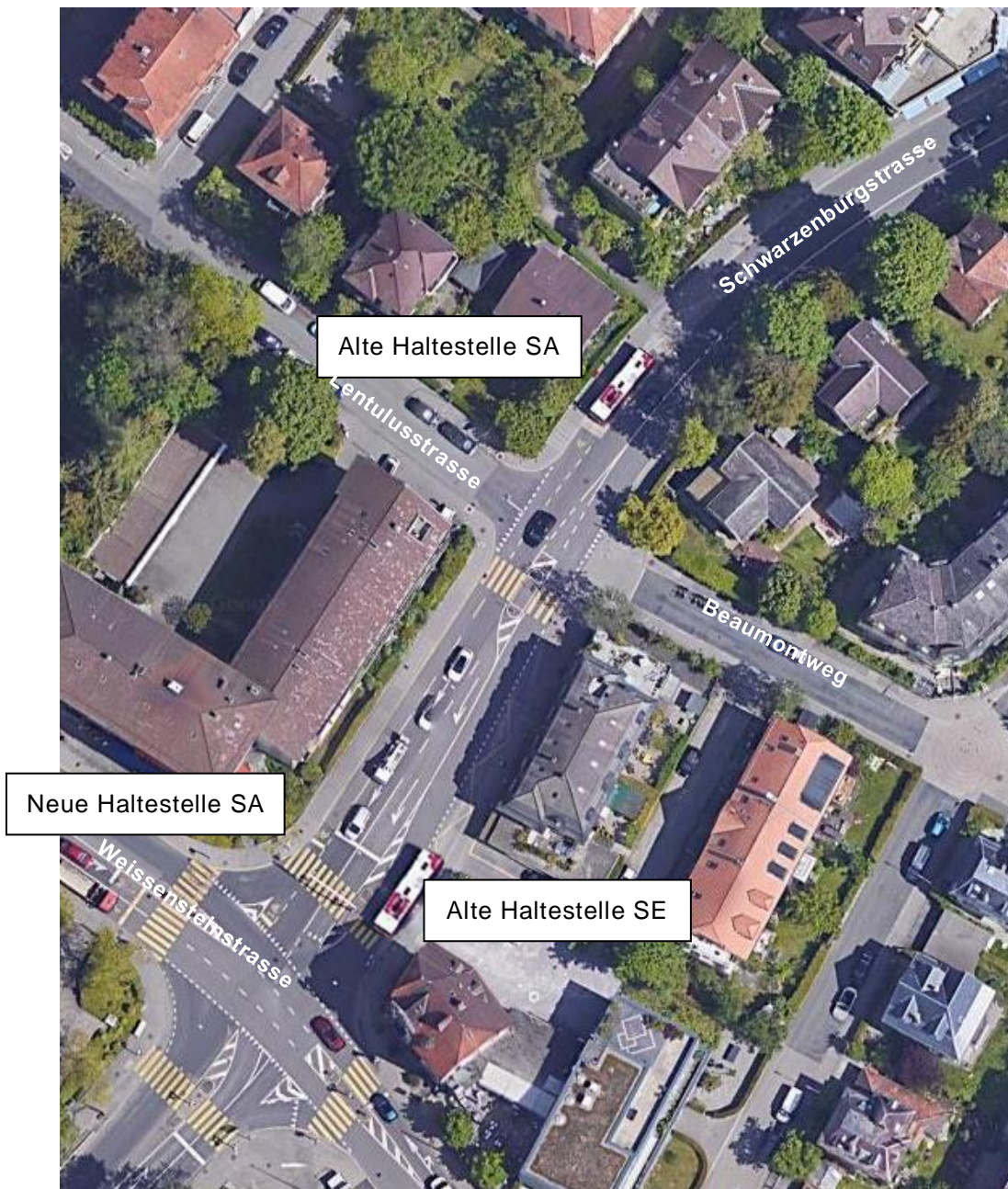
Abbildung 2: Haltestelle Weissensteinstrasse stadtein- (SE) und stadtauswärts (SA) – alter und neuer Standort

Stadteinwärts können die Doppelgelenktrolleybusse die bestehende Haltestelle ohne Schwierigkeiten anfahren, es besteht also kein zwingender Anpassungsbedarf. Velos und der motorisierte Individualverkehr (MIV) können haltende Busse überholen. Da die Haltestelle eine Buchtf orm aufweist, kann sie nicht hindernisfrei ausgestaltet werden (Problematik des «Überstreichens» der Busse).