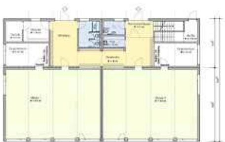
Grundrisse EG - 2. OG, Erne AG

Um den Bedarf der Volksschule Pestalozzi kurzfristig zu decken, wird ein Modulbau mit sechs Klasseneinheiten benötigt. Der dreistöckige Modulbau soll auf der Munzingerwiese neben der heutigen Aula (ehemals Turnhalle) errichtet werden. Die Parzelle ist als Nutzungszone «Freifläche B» und somit als Zone für öffentliche Nutzung bezeichnet. Planungsrechtlich ist ein Bau in der benötigten Grössenordnung grundsätzlich bewilligungsfähig. Das Areal ist erschlossen und die Terrainverhältnisse verlangen keine aufwändigen Grabarbeiten. Die Nähe zum Schulhaus Munzinger schafft räumliche Synergien mit dem bestehenden Schulbetrieb.