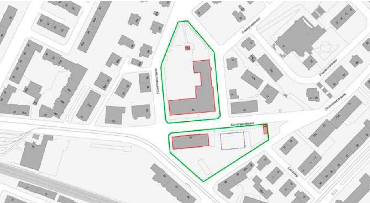
Zur Schule VS Munzinger gehörende Gebäude (rot) auf der Parzelle (grün), möglicher Standort Modulbau (blau)