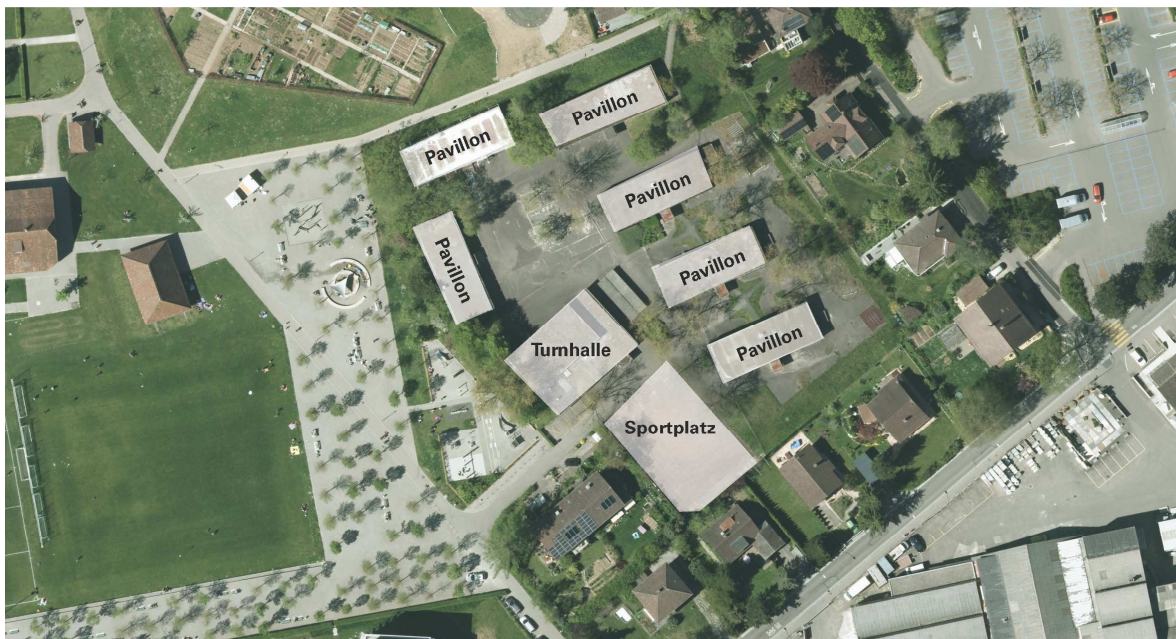
Bestehende Situation: Brünnengut und Brünnenpavillons

Am besten eignet sich das städtische Grundstück an der Brünnenstrasse 15. Auf dem Areal kann Platz für das geforderte Raumprogramm geschaffen werden, womit grössere Schulen während der Sanierung nicht auf verschiedene Standorte aufgeteilt werden müssten. Auf dem Areal gibt es zudem bereits eine Turnhalle, ein Aussenspielfeld und attraktive Umgebungsflächen für den Pausenbetrieb. Turnhalle, Sportplatz und Aussenraum werden instandgesetzt, um den zukünftigen Nutzungsanforderungen entsprechen zu können.