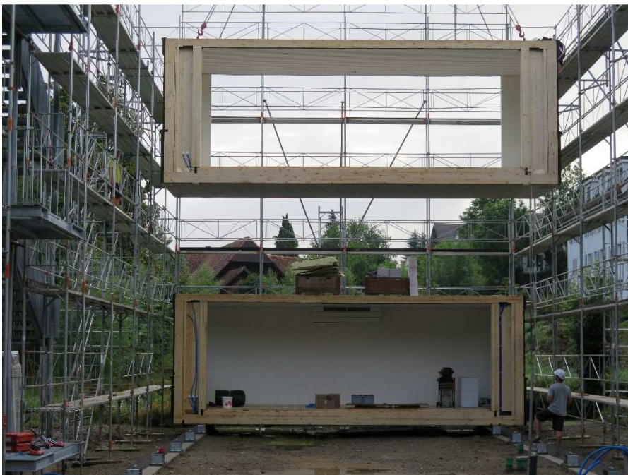
Montage Modulbauprovisorium Schulanlage Wyssloch