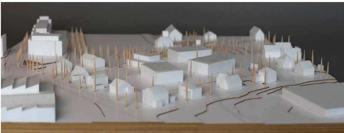
Modellfoto Projekt Brünnpavillons (schematische Baukörper)

Die drei zweigeschossigen Neubauten bilden zusammen mit der Turnhalle einen geschützten Hof aus. Sämtliche Aufenthalts- und Erschliessungsbereiche werden in diesem Hofraum gebündelt. Damit können die umliegenden Einfamilienhäuser von den mit der Schulnutzung verbundenen Lärmemissionen abgeschirmt werden.