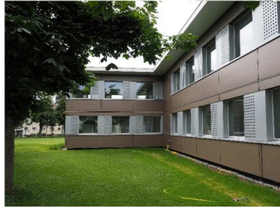
Modulbau Pestalozzi Bern, zweigeschossig abgewinkelte Form