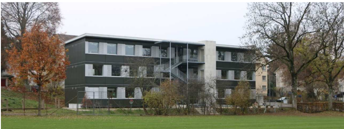
Modulbau Wyssloch Bern, dreigeschossig

Die zu erstellenden Modulbauten an der Brünnpstrasse werden typähnlich und kompatibel erstellt mit den Schulraumprovisorien, welche bereits an den Standorten im Marzili, Pestalozzi und Wyssloch erstellt worden sind. Die Modulbauten an der Brünnpstrasse werden zweigeschossig erstellt mit einem Mittelflur (Grundriss s. Ziffer 3.4).