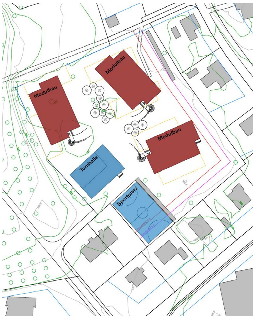
Standort der drei neu zu erstellenden Modulbauten. Sportplatz und Turnhalle bleiben bestehen und werden saniert.

Die zweigeschossigen Modulbauten für 14 Klassen mit zugehöriger Tagesschule sollen auf der stadteigenen Parzelle an der Brünnerstrasse errichtet werden. Die bestehende Turnhalle und der Aussensportplatz bleiben erhalten. Die Parzelle befindet sich in der «Freifläche C», einer Zone für öffentliche Nutzungen. Planungsrechtlich ist das Provisorium in der benötigten Grösse bewilligungsfähig. Das Areal ist gut erschlossen, die Terrainverhältnisse verlangen keine aufwändigen Erdarbeiten und der Aussenraum, unmittelbar angrenzend an den Brünnerpark, ist attraktiv.