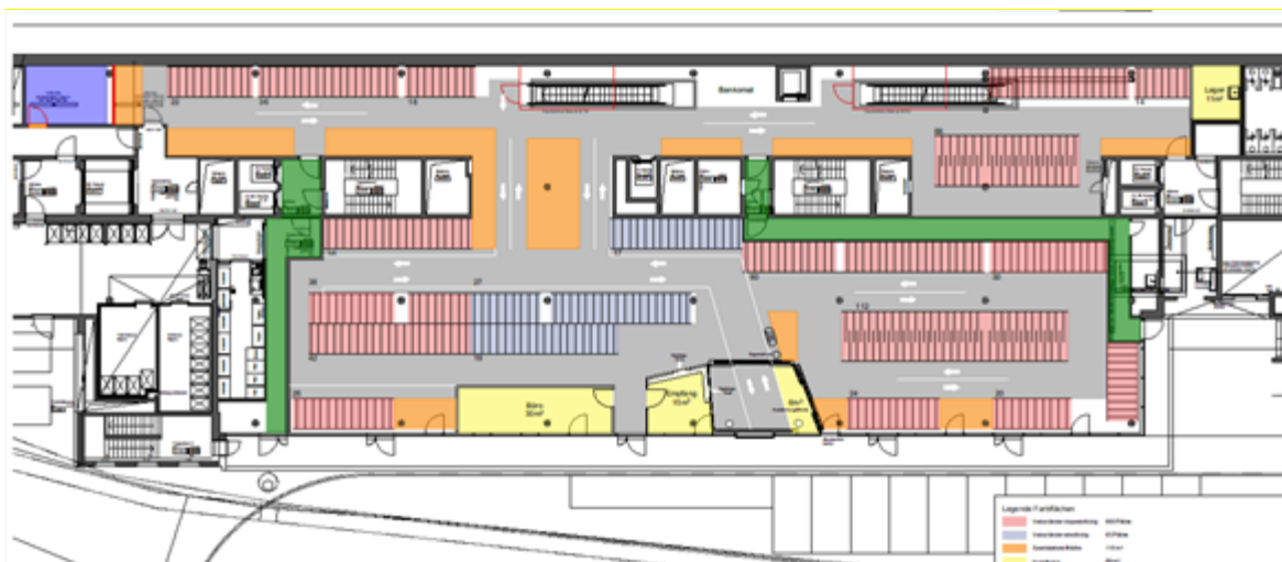
Grundriss Velostation Welle 7

Die Migros erklärt sich bereit, den gesamten Rückbau der aktuellen Einbauten auf der Ebene 0 sowie den grössten Teil des Innenausbaus zu übernehmen und die Investition von ca. Fr. 700 000.00 über den Mietzins zu amortisieren. Die Kosten für den von der Stadt zu tragenden Mieterausbau (Anpassung Elektro, Beleuchtungskörper, Veloabstellsystem mit ein- und doppelstöckigen Ständern, Garderobenschranksystem, Mobiliar, mieterseitige Malerarbeiten sowie Signalisation und Honorar Planer) betragen Fr. 525 000.00 (vgl. Ziff. 4).