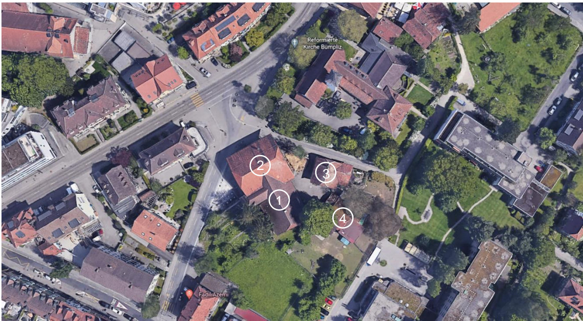
Satellitenbild Situation Isenschmiedgut