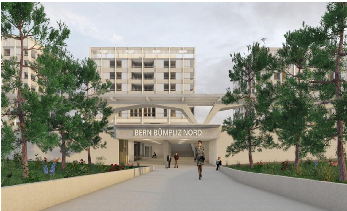
Abbildung 2: Visualisierung Personenunterführung mit Blickrichtung von der Seite Tscharnergut/Fellerstrasse (Abbildung aus dem Vorprojekt; Stand 21. Dezember 2021)