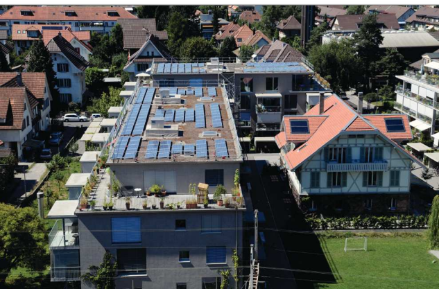
Die Siedlung Burgunder der gemeinnützigen Trägerschaft npg ag an der Burgunderstrasse in Bümpliz: Die Stadt Bern fördert den gemeinnützigen Wohnungsbau unter anderem durch die Abgabe von Bauland im Baurecht.

Keine der geprüften Massnahmen drängte sich als möglicher Gegenvorschlag zur Wohn-Initiative auf. Einige Varianten kamen nicht in Frage, weil sie dem Kernanliegen des Initiativkomitees, flächendeckend Bauland für preisgünstige und gemeinnützige Wohnungen verfügbar zu machen, zu wenig Rechnung tragen. Einige Varianten wurden im Rahmen von parlamentarischen Vorstössen vom Stadtrat bereits abgelehnt oder werden von der Stadt bereits praktiziert und stellen daher keine Innovation dar.