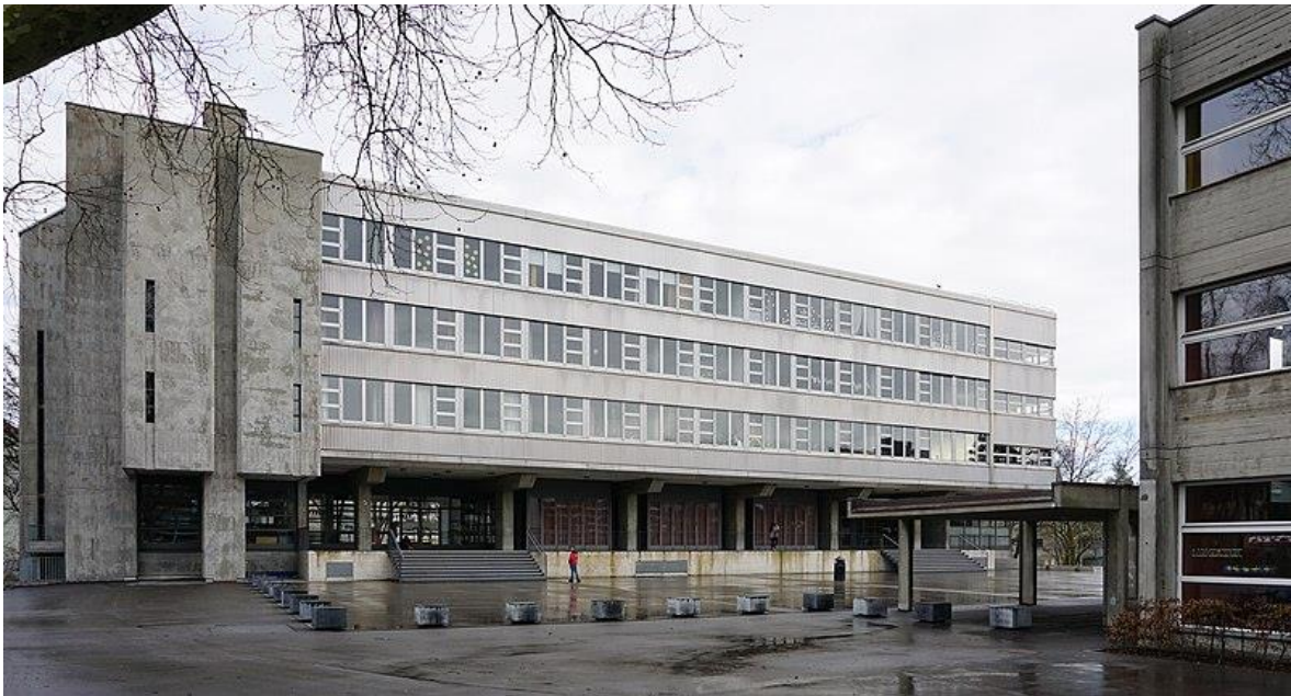
Südwestfassade der Fellerstrasse 18

Das Terminprogramm sieht die Planungsphase der Gesamtanierung ab März 2024 vor.