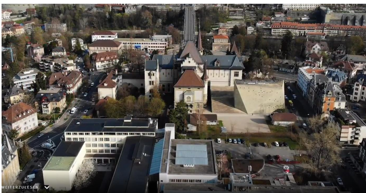
Vogelperspektive des Museumsquartiers von Süden Richtung Kirchenfeldbrücke