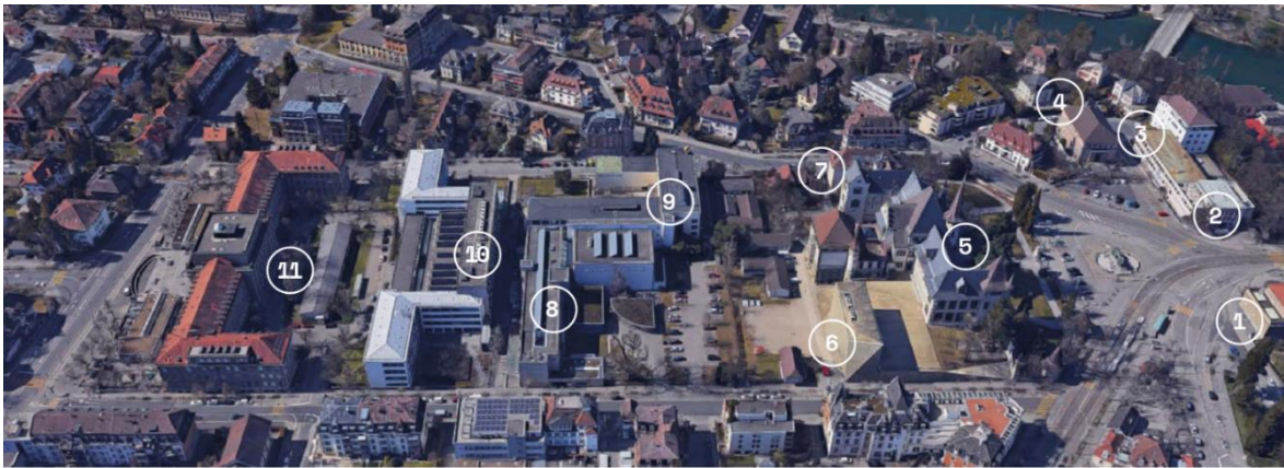
Übersicht der beteiligten Institutionen des Museumsquartier Bern: