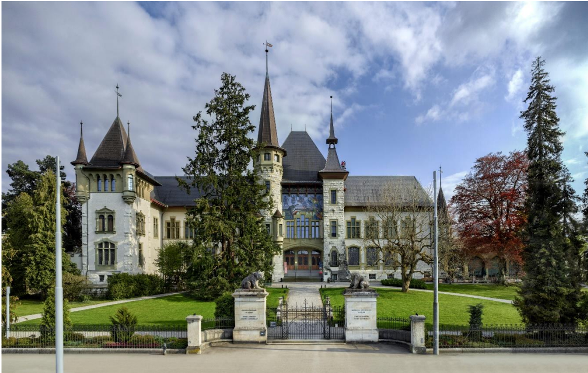
Bernisches Historisches Museum, Haupteingang Seite Helvetiaplatz

historische und ethnografische Kulturgüter – insbesondere von Stadt und Kanton Bern – zu sammeln, zu bewahren, zu dokumentieren, zu erforschen und zu vermitteln. Seit 1998 beteiligen sich die Regionsgemeinden an der Finanzierung des Museumsbetriebs mit 11 Prozent der gesamten Subventionen. Sie entlasten damit den Beitrag der Stadt, der noch 22,3 Prozent beträgt. Dies ist im Rahmen einer jeweils für vier Jahre gültigen quadripartiten Leistungsvereinbarung geregelt. Das BHM wird durch einen Stiftungsrat geführt, in dem alle Subventionsgeber*innen vertreten sind.