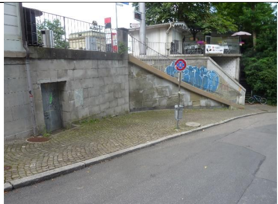
Abb. 7: Zugang Klösterlistutz wird neu gestaltet mit Rampe und Treppe (Ausführung geplant in Etappe 1)