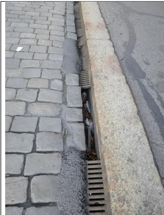
Abb. 8: Entwässerungsrinnen grösstenteils defekt (Instandstellung geplant in Etappe 1)