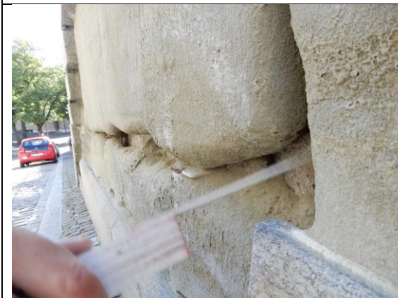
Abb. 10: Absandung (tiefgründig) am Brückenbauwerk (Instandstellung geplant in Etappe 2)