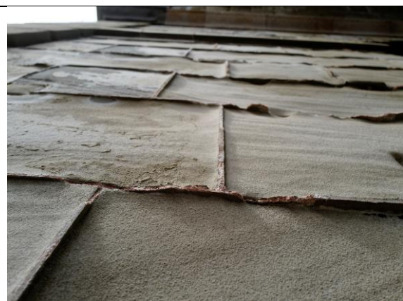
Abb. 13: Absandung (flächig) am Brückenbauwerk (Instandstellung geplant in Etappe 2)