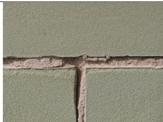
Abb. 11: Ausgewitterte Mörtelfuge (Instandstellung geplant in Etappe 2)