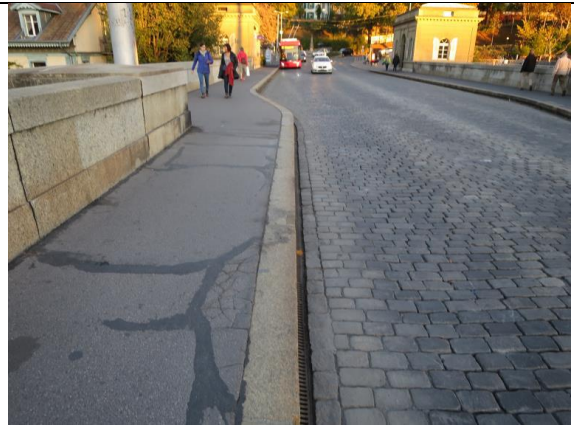
Abb. 3: Spurrinnenbildung in der Pflasterung (Instandstellung geplant in Etappe 1)