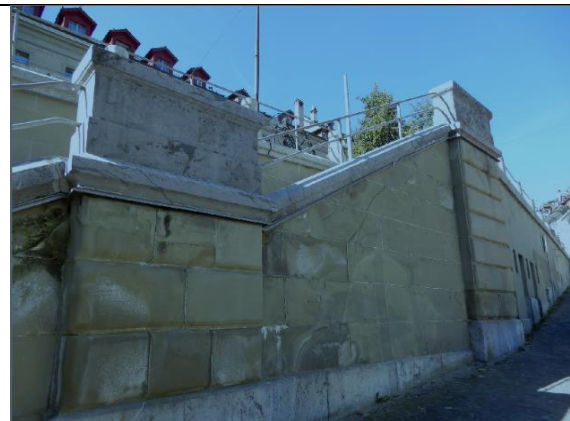
Abb. 6: Zwillingsstreppe, Schäden und Salzausfällung (Instandstellung geplant in Etappe 1)