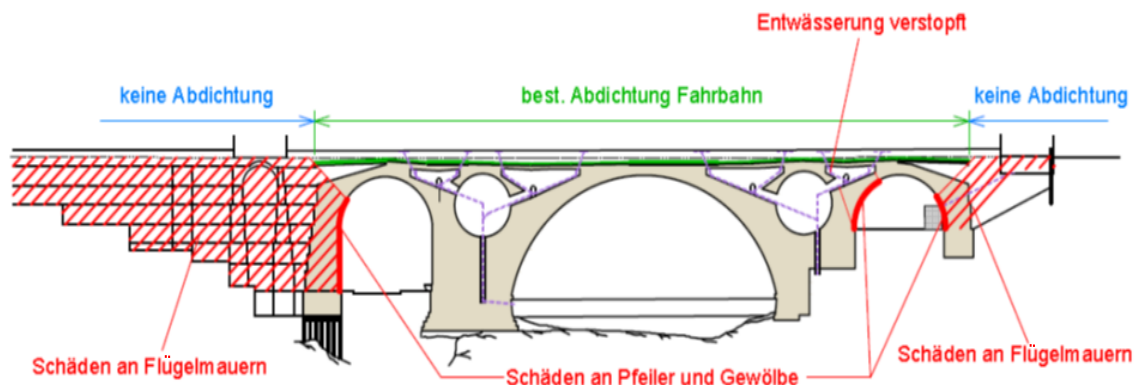
Abb. 1: Skizze Schadensbildung

Auch die Brückenoberfläche ist schadhafte: Hier ist die Beanspruchung durch den Verkehr inzwischen derart gross geworden, dass der Unterhalt intensiviert werden musste, damit die Gebrauchstauglichkeit der Brücke erhalten werden konnte. Durch die starke Belastung haben sich in der Pflasterung tiefe Spurrinnen gebildet, in denen sich bei Regen und Schneefall gefährliche Wasserlachen bilden. Die zahlreichen Verformungen im Pflasterbelag stellen insbesondere für Velofahrer*innen zunehmend ein Sicherheitsproblem sowie generell eine unbefriedigende Situation für alle Verkehrsteilnehmenden dar. Zudem sind die seitlichen Entwässerungsrinnen mehrheitlich defekt.