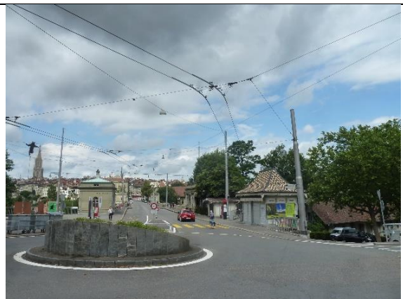
Abb. 5: Der Kreisel beim Bärengraben und die Sichtachse der Brücke werden leicht verschoben. Es erfolgt eine Neugestaltung (Ausführung geplant in Etappe 1)