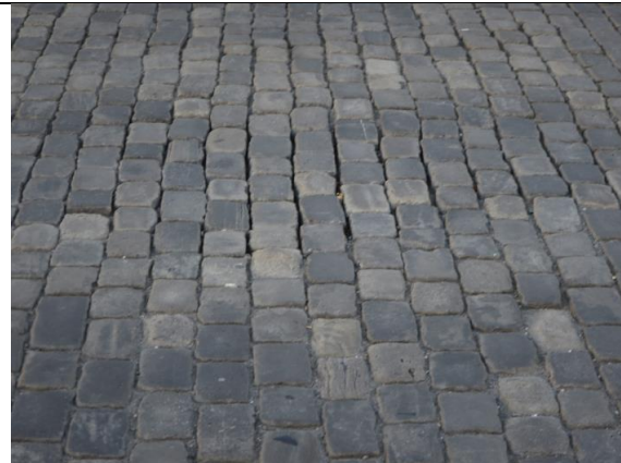
Abb. 2: Fehlende Fugenfüllung in Pflasterung, verschobene Steinreihen (Instandstellung geplant in Etappe 1)

Nachfolgend einige Schadensbilder des Bauwerks: