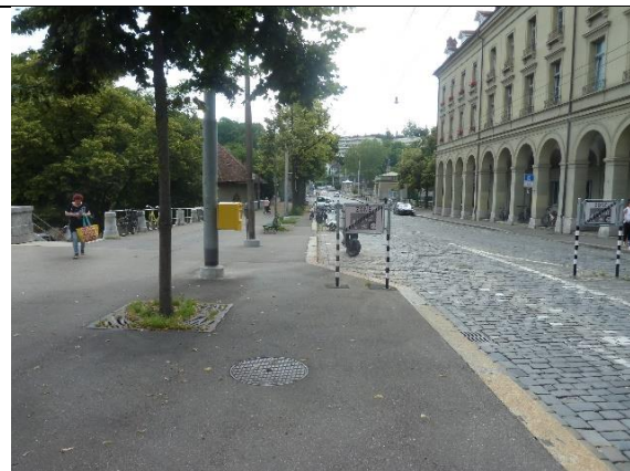
Abb. 4: Situation Baumreihen. Die Baumreihe weist Lücken auf, zudem befinden sich die Linden in einem sehr schlechten Zustand (Instandstellung geplant in Etappe 1)