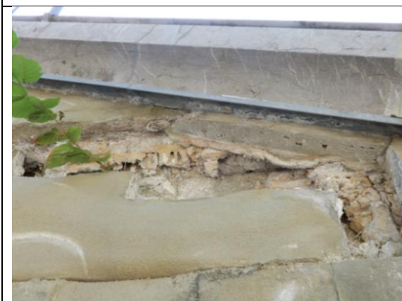
Abb. 12: Verstärkter Schaden an der Hofmauer bei der Treppe (Instandstellung geplant in Etappe 2)